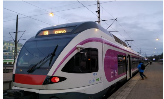
Tomando el tren en la Estación central de Helsinki

El jueves comenzamos con clase de física comienza a las 10.45. El tema de hoy es el sonido y sus propiedades.